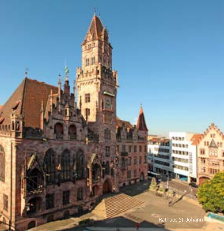
Rathaus St. Johann